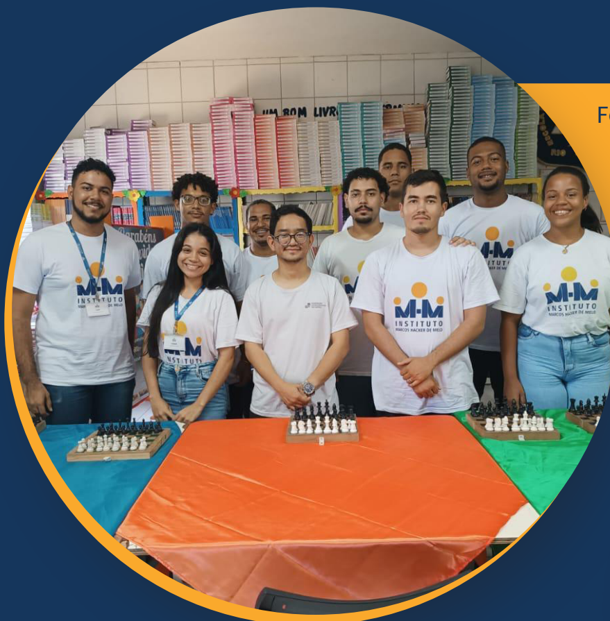
Foto do time que recebeu a certificação junto à Federação Pernambucana de Xadrez.

Photo of the team that received certification from the Pernambuco Chess Federation.